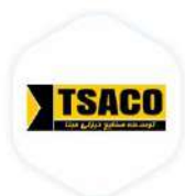
توسعه صنایع دیزلی مینا