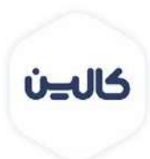
گروه صنایع غذایی کالین