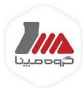
شرکت مهندسی و ساخت لوکوموتیو مینا