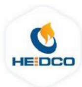
مهندسی و صنایع همپا انرژی