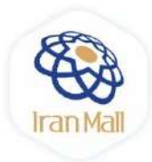
بازار بزرگ ایران (ایرانمال)