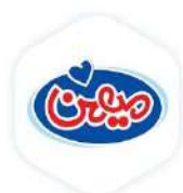
گروه صنعتی میهن