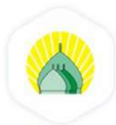
آستان مقدس حرم عبدالعظیم