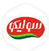
صنایع غذایی سولیکو کاله